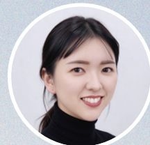
アートメイク看護師

色素は通常2~3回の施術で定着するといわれますが、個人差があります。 骨格や筋肉の動き、自眉毛の生え方・癖により左右差が生じることがあるため、 施術前にアートメイク施術看護師が細部やご希望をカウンセリングさせていただきます。